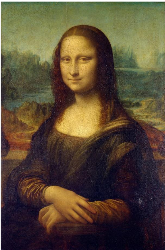
La Joconde – Leonard de Vinci